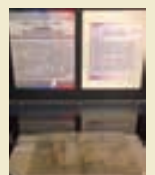
相互貸借特集展示II

8月29日(土) せいなん子どもワークショップ2015 「マール紙をつくろう」を実施しました。