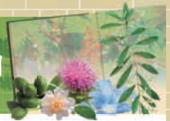
([下図]A～Dの5エリアが植物園)

本号より新連載企画として、本学博物館のキャンパス各所に設置された「西南学院大学聖書植物園」について紹介いたします。本植物園は1999年11月、大学開学50周年の記念事業として開園されました。約2000年前に執筆された聖書に登場する植物を復元・展示する試みは、全国的に見てもほとんど例がありません。9種の展示から始まった植物園も、現在では100種を超える植物に囲まれるまでに成長しましたが、今日に至るまで植物園にまつわる様々なエピソードが生まれました。 また、キャンパス東側に本学博物館、西側に史跡防塁跡、そしてキャンパス全体に広がる聖書植物園の3施設を併せる