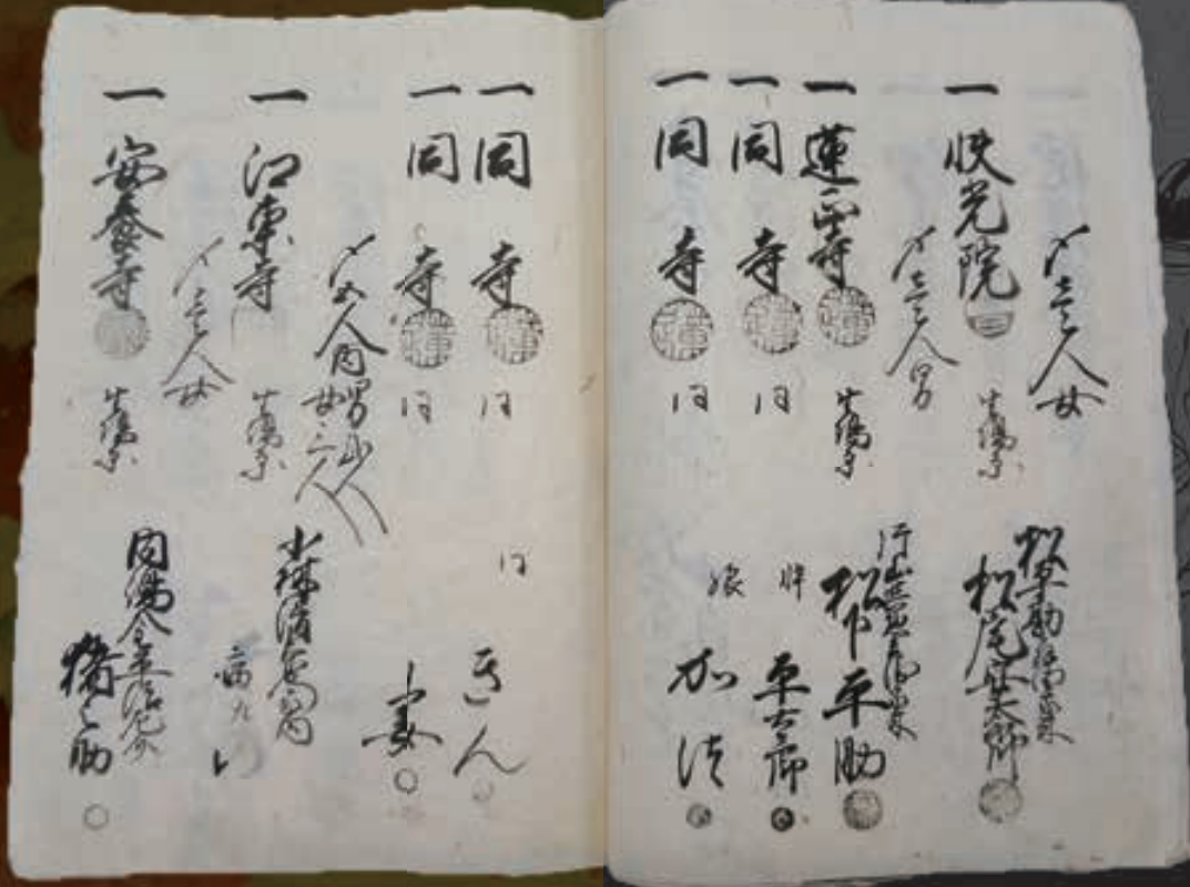
宗門御改影踏帳