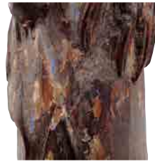
聖母のローブに付着した青い顔料