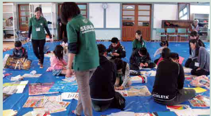
天草キリシタン館の特別展関連イベントとして行ったワークショップの様子 天草キリシタン館で行われた当館コレクション展の展示風景