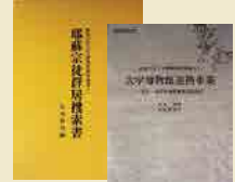
官学・産官学連携事業実践報告