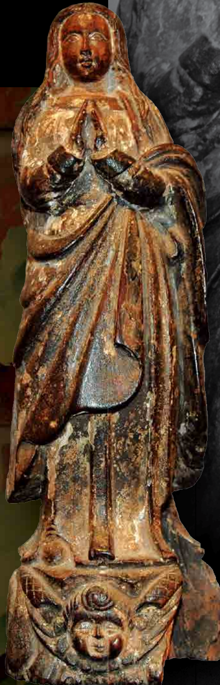
無原罪懐胎の聖母マリア像 [西南学院大学博物館所蔵]