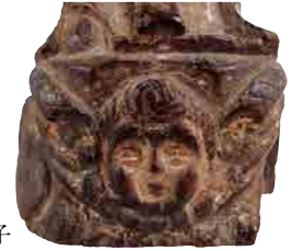
聖母の足もとに彫られた天使の様子

スペインの作例を参考としている可能性が高いと思われます。また、聖母マリアのローブにはかすかな青の顔料が付着しており、青いローブをまとっていたと考えられ、その点も本主題の17世紀の伝統的図像に従っているといえます。サントの制作には、専門の職人のほか、一般信徒たちも制作したものがあありますが、本資料は伝統的な図像の採用と、聖母の顔や衣服に細やかな表現が見られることから、職人によるものと思われます。