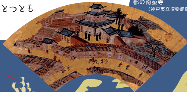
都の南蛮寺 (神戸市立博物館蔵)

キリスト教を信仰する中心の場として、教会堂が作られました。そのなかには、日本の建物の屋根に十字架を立てた「南蛮寺」というものがあります。これらの建物は南蛮風俗が流行した当時には都の名所のひとつともなっていました。