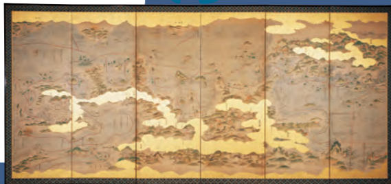
海路図屏風 (神戸大学海事博物館蔵)

1 どの時代でも、世界の国々の交流に必要なものは船でした。広大な海での旅はとても危険でしたので、船の改良が進み、海の地図である「航路図」が作られました。航路図には、細かい距離などがのってあり、海で迷わず目的地につくために重要なものでした。