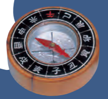
磁石 (神戸大学海事博物館蔵)