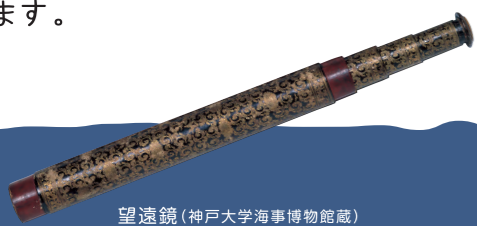
望遠鏡 (神戸大学海事博物館蔵)