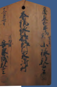
宗門鑑札 (梅光学院大学博物館蔵)

日本ではキリスト教を広めることが禁止されました。それからしばらくして、キリスト教を信じることも許されなくなりました。これを日本中のひとびとに知らせるための板札が各地に立てられ、なかには信じていないことを証明する木札を持つひともしました。