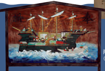
南蛮船絵馬 (西南学院大学博物館蔵)