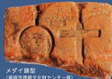
メダイ鑄型 (福岡市埋蔵文化財センター蔵)

かつて海の旅は命をかけた危険なものでした。遠くからキリスト教を伝えるためにやってきた宣教師たちも、苦勞をして海を渡ってやって来ていました。日本にやって来た人々やモノは当時の日本人に大きな影響を与え、日本の文化と混ざり合い、そこから新しい文化が生まれました。そのような歴史を、残された“モノ”たちは私たちに教えてくれます。