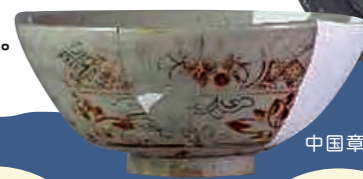
中国・同安窯系青磁皿 (福岡市埋蔵文化財センター蔵)

九州地域では、古くから近くの大陸(おもに今の中国や韓国)との交流がありました。とくに福岡には陶磁器などが伝えられています。