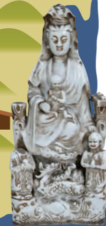
マリア観音像 (西南学院大学博物館蔵)

キリスト教が禁止されていたなかで、隠れてキリスト教を信仰していた人々もいました。観音様をマリア様に見立てたり、鏡に光を当てるとイエス様の像が見えたりと工夫して祈りをさげていました。