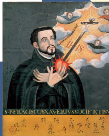
ザビエル像 (神戸市立博物館蔵)