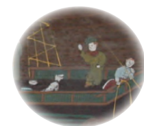
犬を調教している南蛮人