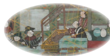
商談している様子