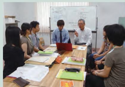
印刷業者との打ち合わせ