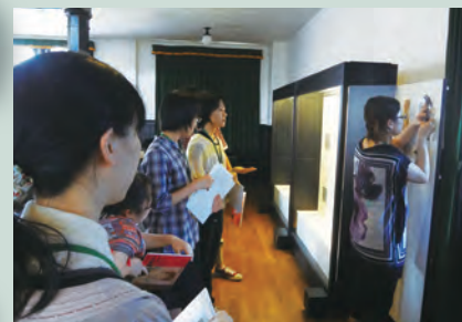
パネルを打ちつける作業