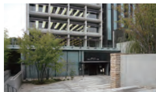
國學院大學博物館