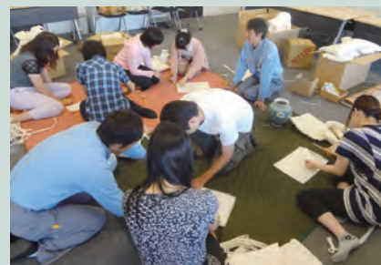
日通による梱包実習