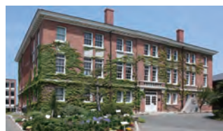
西南学院大学博物館

日本人の信仰の源流をたどるとともに、今日に至るまでどのような転機があったのか。祈りの変遷のなかで、近代宗教教育の姿にも迫っていきます。なお、本展覧会はこれまでの開催してきた大学博物館共同企画であるとともに、2011年度に西南学院大学博物館が採択された学内GP「大学博物館における高度専門学芸員養成事業」の成果の一部になります。