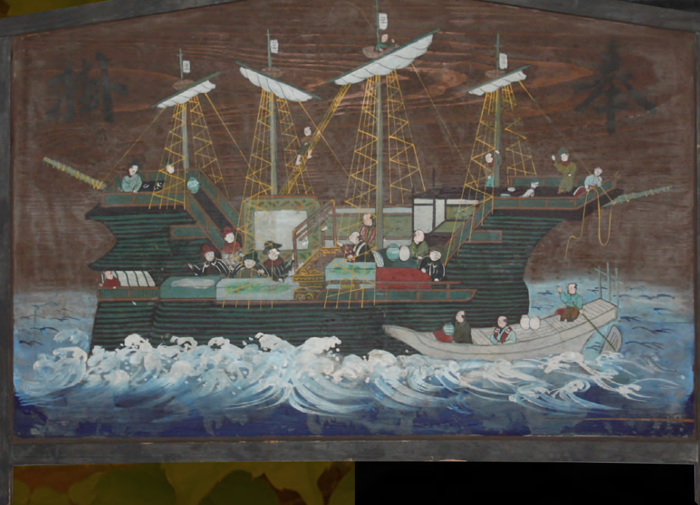
南蛮船奉納絵馬【西南学院大学博物館所蔵】