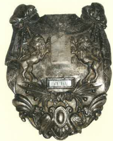
JUDAICA COLLECTION II